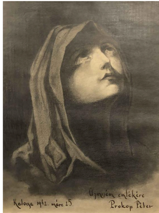
Szűzanya - 1942